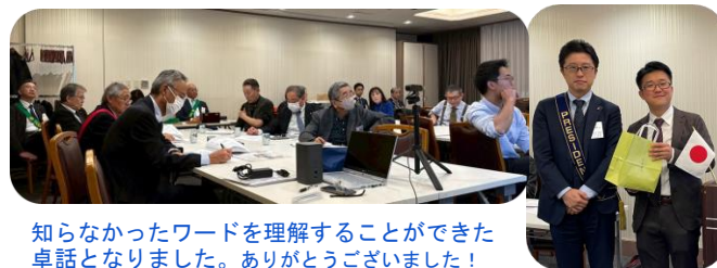
知らなかったワードを理解することができた卓話となりました。ありがとうございました！